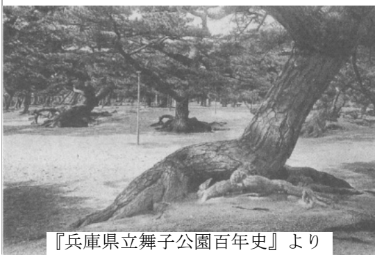
『兵庫県立舞子公園百年史』より